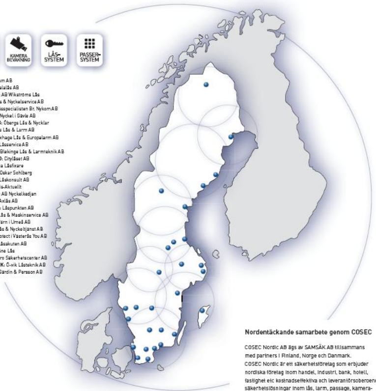
Nordentäckande samarbete genom COSEC

BORÅS: Låsteam AB BORLÄNGE: Dalalås AB FALKENBERG: AB Wikströms Lås FÄLLIN: Fallås & Nyckel-service AB GÖTEBORG: Låsspecialisten Br Nykom AB GÄVLE: Lås & Nyckel i Gävle AB Helsingborg: Öberg Lås & Nycklar HÖRBY: Allians Lås & Larm AB Jönköping: Yrhage Lås & Europalarm AB KALMAR: WJ Låsservice AB KARLSHAMN: Blakinge Lås & Larmteknik AB KRISTIANSTAD: Citylås AB KIRUNA: Kiruna Låstjänst LJUNGBY: AB Oskar Selberg LULEÅ: Luleå Låsspecial AB MALMÖ: AB Lås-Aktuellt NORRKÖPING: AB Nyckelkadan STOCKHOLM: Axlås AB SUNDBYBERG: Låspunkten AB SUNDSVALL: Lås & Maskinservice AB UMEÅ: Lås & Jern i Umeå AB VISBY: Visby Lås & Nyckeltjänst AB VÄSTERÅS: Protect i Västerås You AB VÄXJÖ: Elms Låskuteln AB YSTA: AB Sjöns Lås ÖREBRO: Örebro Säkerhetscenter AB ÖRNSKÖLDSVIK: Övik Låsteknik AB ÖSTERSUND: Gardin & Persson AB